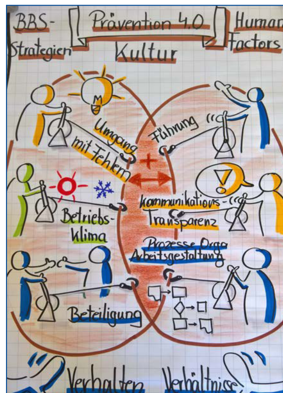
Abb. 2 erfolgreiche Prävention; Begriffserklärungen unter www.dguv.de - Webcode d162327