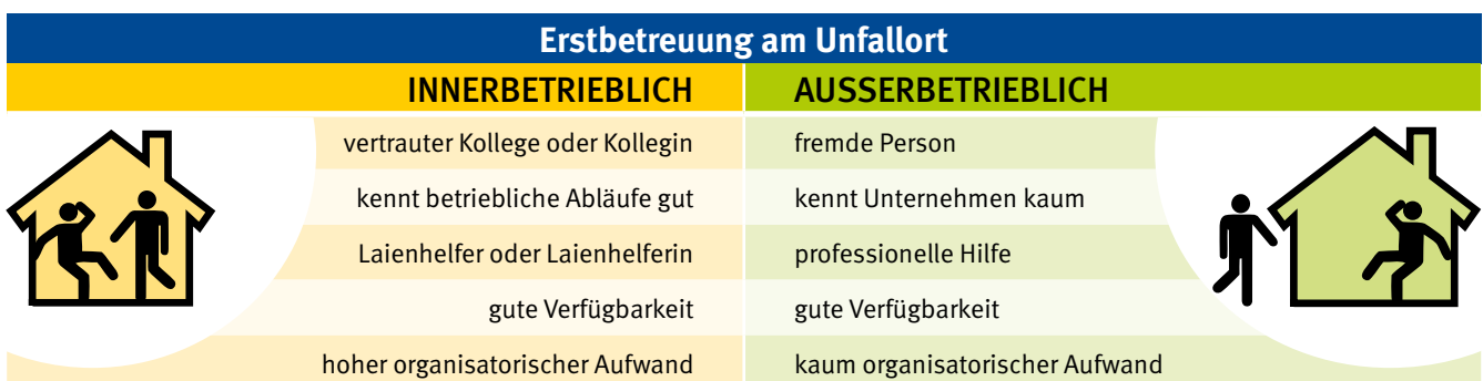
Abb. 2 Die psychologische Erstbetreuung kann auf verschiedene Arten sichergestellt werden.